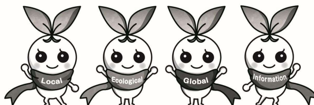
北九州市立大学 公式マスコットキャラクター きたきゅっち